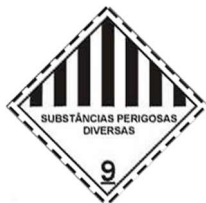
RÓTULO DE RISCO PRINCIPAL