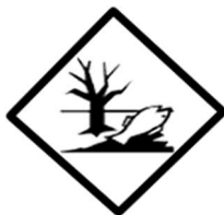
RÓTULO DE RISCO ADICIONAL*