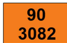
PAINEL DE SEGURANÇA

(* Este símbolo deve ser acrescentado a unidade de transporte nos casos de ONU 3077 ou 3082; conforme exigência da Resolução 5.232 – ANTT / Ministério dos Transportes