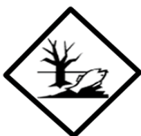
RÓTULO DE RISCO ADICIONAL*