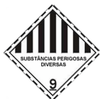
RÓTULO DE RISCO PRINCIPAL