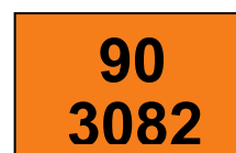
PAINEL DE SEGURANÇA