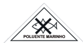
RÓTULO DE RISCO ADICIONAL**