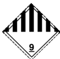
RÓTULO DE RISCO PRINCIPAL